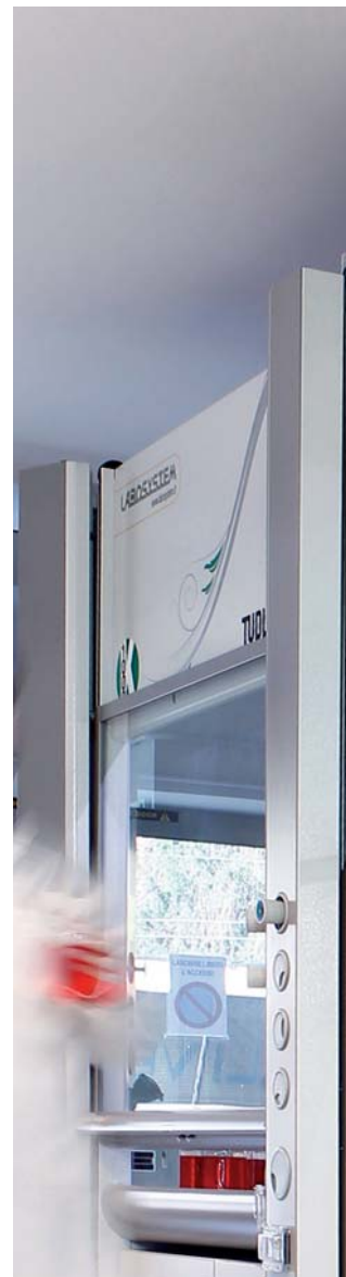
LABOSAFE® l'armadio di sicurezza certificato EN 14727 è totalmente gestito dal controller.