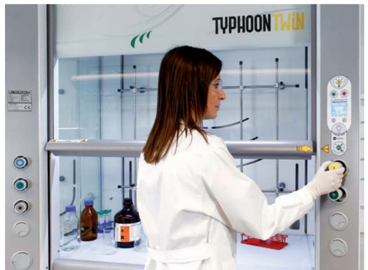
I montanti laterali integrano degli oblò per il passaggio dei cavi di alimentazione.