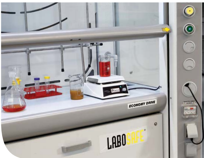
I piani laterali interni con vaschetta integrata sono in Monolite Ipergres®.